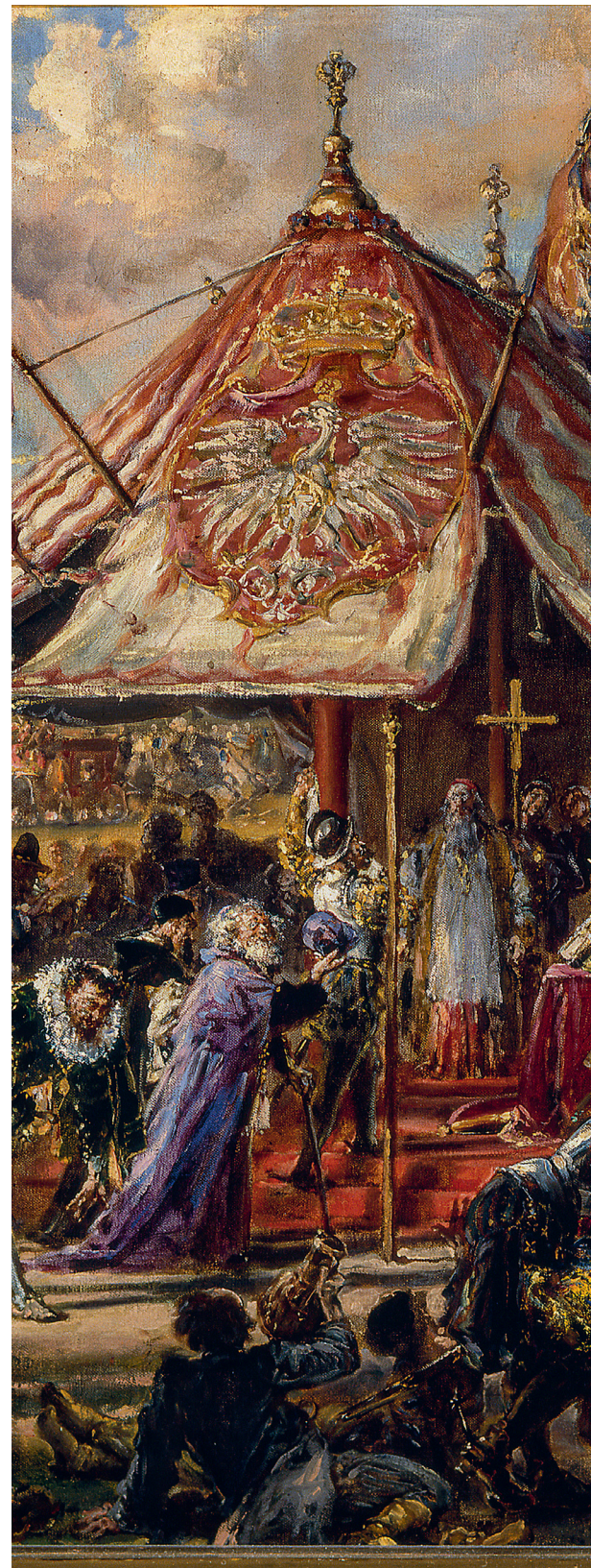
Jan Matejko, Potęga Rzeczypospolitej u zenitu , z cyklu Dzieje Cywilizacji w Polsce , 1889, dep. Muzeum Narodowego w Warszawie