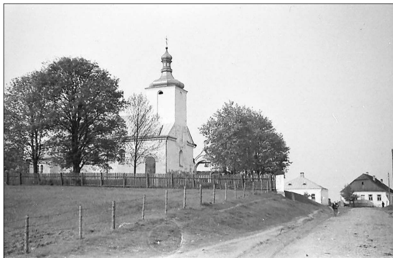
Царква Успення Багародзіцы ў м. Новы Свержань. 1943 г.

Ад пачатку семінарыя пазіцыянавалася менавіта як радзі-