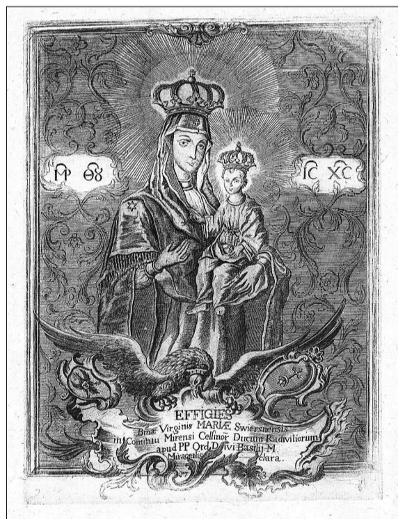
Абраз «Божая Маці Свержанская» (Новасвержанская). Гравюра з кнігі «Поўня прыгажэйшая за Месяц, якая служыць промнямі ласкі для свету». Нясвіж, 1754.