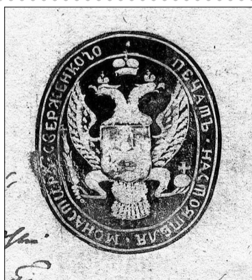
Адбіткі пячаткі рэктара Новасвержанскай духоўнай семінарыі: 1 – Сажавая. Матрыца выкарыстоўвалася ў 1743 – 1818 гг.; 2 – Сургуцкая. Матрыца выкарыстоўвалася ў 1743 – 1818 гг.; 3 – На кустодзеі. Матрыца выкарыстоўвалася ў 1743 – 1818 гг.; 4 – Сажавая. Матрыца выкарыстоўвалася ў 1819 – 1833 гг.

Першы вядомы адбітак пячаткі рэктара семінарыі датуецца сярэдзінай 1740-х гг. На пячатцы авальнай формы выяўлены відзменены герб Радзівілаў – чорны арал з княскай каронай, на грудзях якога тарча з грэцкай абрэвіятурай «IXS» замест звычайных радзівілаўскіх «Трубаў». Як і на традыцыйным радзівілаўскім гербе, арал змешчаны пад княскай мантыяй і княскай каронай. Па коле пячаткі маецца лацінамоўная легенда: «SIGIL(LUM) RECTOR(IS) COL(LEGII) SVERSAN(ENSIS) RADIVILIAN(ORUM) DUC(UM) O(RDINI) S(ANCTI) BASIL(II) MAGNI» («Пячатка рэктара Свержанскага калегіума князёў Радзівілаў ордэна Святога Васіля Вялікага»). Самы позні адбітак гэтай пячаткі быў выяўлены на дакуменце ад 3 снежня 1818 г. На дакуменце, які выйшаў са сцен семінарыі 23 чэрвеня 1819 г., змешчаны адбітак ужо новай пячаткі. На пячатцы авальнай формы выяўлены герб Расійскай імперыі – двухгаловы арал, на грудзях якога змешчана выява Св. Георгія. Па коле пячаткі маецца рускамоўная легенда: «ПЕЧАТЪ НАСТОЯТЕЛЯ МОНАСТІРА СВЕРЖЕН(С)КОГО».