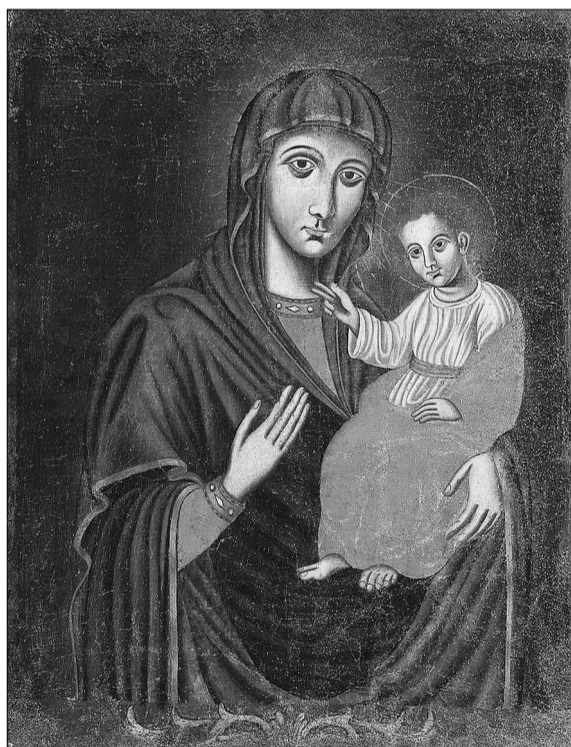
Абраз «Божая Маці Свержанская» (Новасвержанская). Палатно, алеі. З могількавай капліцы в. Самуйлавічы Мастоўскага раёна, XVIII ст.