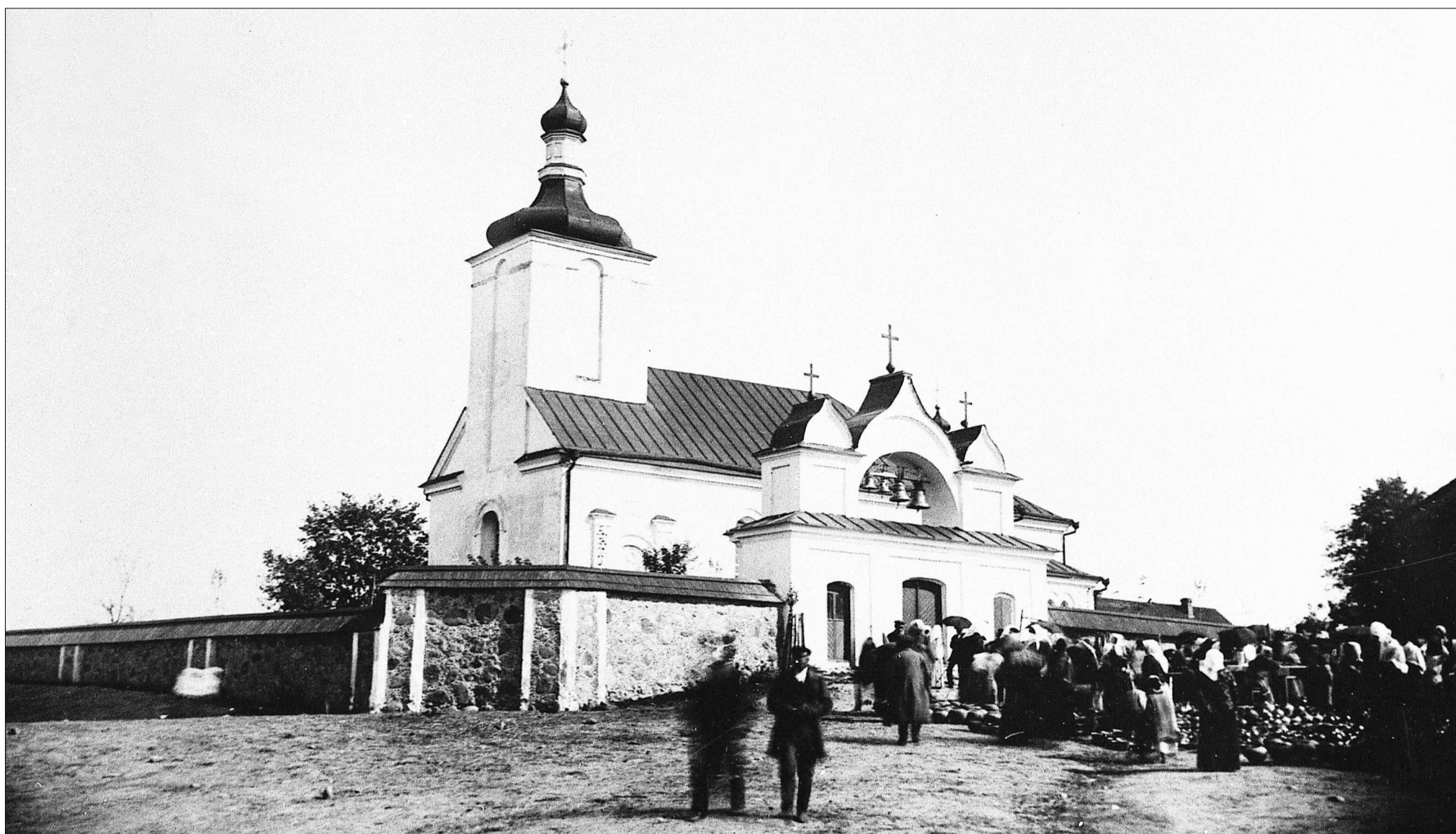
Царква Успення Багародзіцы ў м. Новы Свержань Мінскага павета. 1914 г.