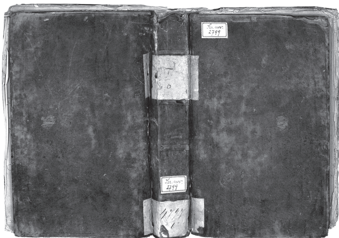
Лл. 1. Знешні выгляд кнігі пратаколаў за 1742–1747 гг.