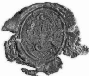
Мал. 14. Пячатка манастыра ў г. Полацку (Св. Барыса і Глеба ў вёсцы Бельчыцы Полацкага павета) 1796 г. [10, арк. 141 адв.]