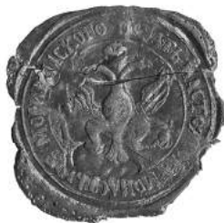
Мал. 11. Пячатка манастыра ў вёсцы Марыівіль Клімавіцкага павета 28 мая 1819 г. [12, арк. 36 адв.]