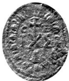
Мал. 3. Пячатка невядомага манастыра (манах Ян Дамаскін Знароўскі) 4 красавіка 1748 г. [8, арк. 1]