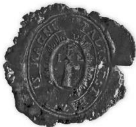
Мал. 12. Пячатка манастыра ў вёсцы Махірова Полацкага павета 1796 г. [10, арк. 183 адв.]