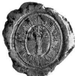
Мал. 9. Пячатка манастыра ў мястэчку Любавічы (Сырыцка-Любавіцкі) Бабінавіцкага павета 30 жніўня 1810 г. [11, арк. 33 адв.]