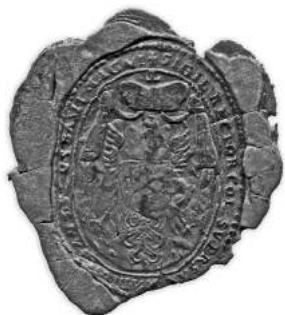
Мал. 5а і 5б. Пячатка рэктара духоўнай семінарыі пры манастыры ў мястэчку Новы Свержань Навагрудскага павета (з 1795 г. – Мінскага павета Мінскай губерні) 1740-я гг. (сажавая) і 23 ліпеня 1812 г. (сургучная) [3; 7, арк. 11]

ява абраза Найсвяцейшай Панны Марыі Барунскай айцоў базыльянаў уніятаў»).