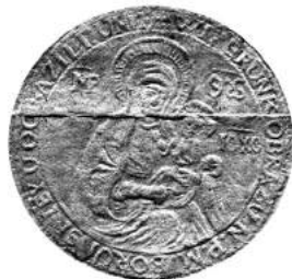
Мал. 4. Пячатка манастыра ў мястэчку Баруны Ашмянскага павета 10 лютага 1747 г.