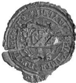
Мал. 16. Пячатка манастыра ў вёсцы Пустынькі Мсціслаўскага павета (Пустынькі Мсціслаўскія) 23 лістапада 1807 г. [13, арк. 14 адв.]