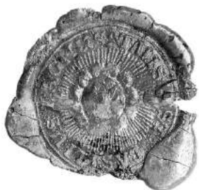
Мал. 18. Пячатка манастыра ў вёсцы Тадуліна Суражскага павета 1796 г. [10, арк. 195 адв.]