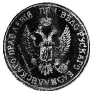
Мал. 21 і 22. Пячаткі Беларускага базыльянскага праўлення 14 ліпеня 1810 г. і 27 верасня 1813 г. [11, арк. 35 адв., 82 адв.]