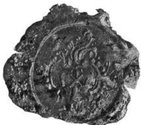
Мал. 8. Пячатка манастыра ў вёсцы Ліскі Рагачоўскага павета 18 чэрвеня 1819 г. [12, арк. 32]