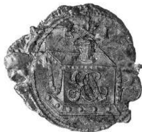
Мал. 23. Пячатка правінцыяла Беларускай правінцыі базыльянскага ордэна Дзяніса Раманоўскага 15 чэрвеня 1808 г. [14, арк. 14]

с. 17]. З гэтага часу на пячатках усіх устаноў павінна была змяшчацца выява дзяржаўнага герба.