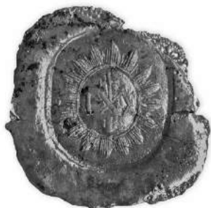
Мал. 19. Пячатка манастыра ў мястэчку Талачын Копыскага павета 1796 г. [10, арк. 286 адв.]