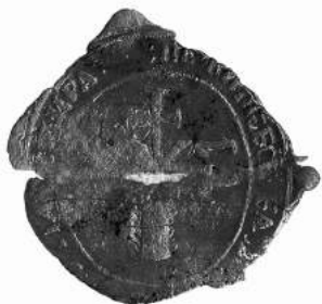
Мал. 6. Пячатка манастыра ў г. Віцебску Віцебскага павета 8 чэрвеня 1808 г. [15, арк. 35 адв.]