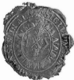
Мал. 15. Пячатка манастыра ў г. Полацку (Св. Сафіі) 1796 г. [10, арк. 195 адв.]