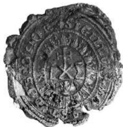
Мал. 7. Пячатка манастыра ў вёсцы Дабрыгоры Лепельскага павета 30 жніўня 1810 г. [11, арк. 33 адв.]