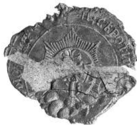
Мал. 17. Пячатка манастыра ў мястэчку Сіроціна Полацкага павета 1 кастрычніка 1813 г. [11, арк. 93 адв.]