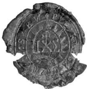
Мал. 20. Пячатка манастыра ў мястэчку Ушачы Лепельскага павета 14 кастрычніка 1808 г. [15, арк. 89 адв.]

Сабраныя, структураваныя і прааналізаваныя адбіткі пячатак манастыроў Беларускай правінцыі дазваляюць прыйсці да наступных высноў.