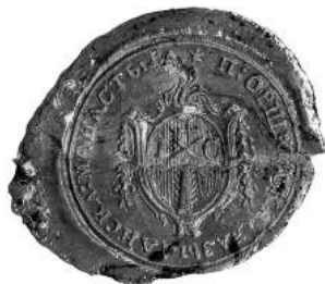
Мал. 13. Пячатка манастыра ў г. Орша Аршанскага павета 23 кастрычніка 1808 г. [9, арк. 96]