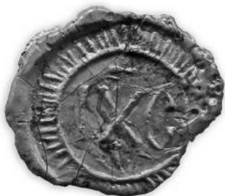
Мал. 2. Пячатка манастыра ў вёсцы Сялец Рэчыцкага павета ВКЛ 14 чэрвеня 1742 г.

У яе аснове выява чудатворнага абраза Маці Божай Барунскай і легенда па коле «WIZERUNK OBRAZUN(AJŚWIĘTSZEJ) P(ANNY) M(ARYI) BORUNSKIEY OO(YCÓW) BAZILI(ANÓW) UNIT(ÓW)» («Вы-