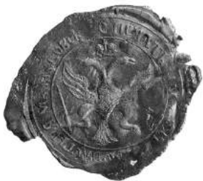
Мал. 10. Пячатка манастыра ў вёсцы Малашкавічы Клімавіцкага павета 28 мая 1819 г. [12, арк. 34]